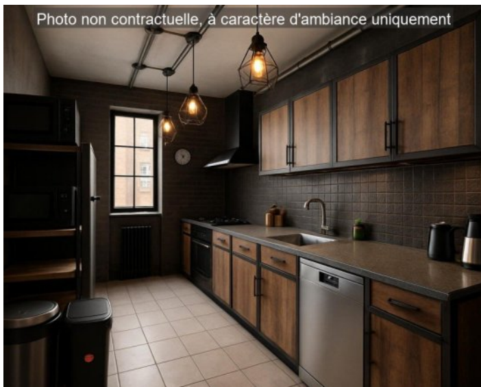
Photo non contractuelle, à caractère d'ambiance uniquement